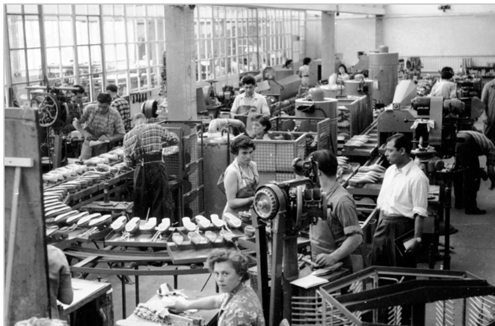
Manufaktur in Bad Soden im Jahre 1958 - Manufactory in Bad Soden in the year 1958

On his wedding day on May 19, 1873, the master shoemaker Eberhard Müller opened his shop „for the production of natural shoes“ in the Ziegelgasse 12 on Liebfrauenberg in Frankfurt am Main. The „technician for natural footwear“ manufactures his „Angulus shoe“ and gives the „only guarantee to cure all organic foot disorders.“ After a long development time, Eberhard Müller obtains the patent for his Angulus shoe from the Imperial Patent Office. The Angulus system (Angulus = Greek: angle) takes into account the natural foot shape in the manufacture of shoes, a development that will be groundbreaking in the shoe orthopedic area and later influenced many shoemakers.