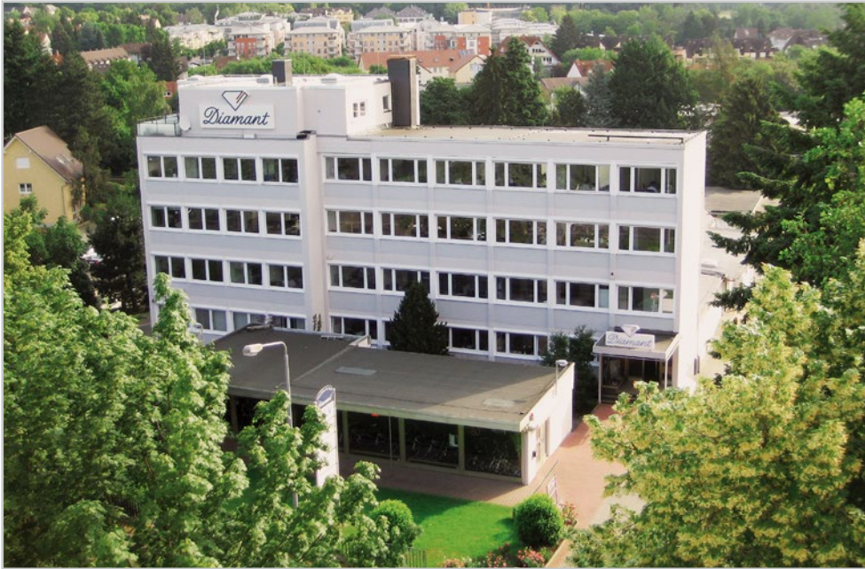
Unternehmenssitz in Bad Soden am Taunus - Headquarters in Bad Soden am Taunus