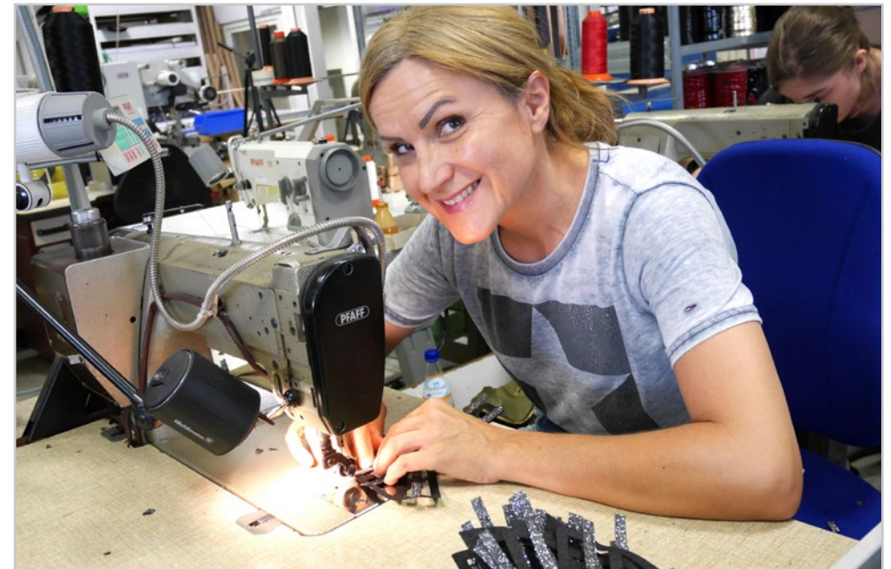
Daliborka: im Unternehmen seit 1993 - in the company since 1993