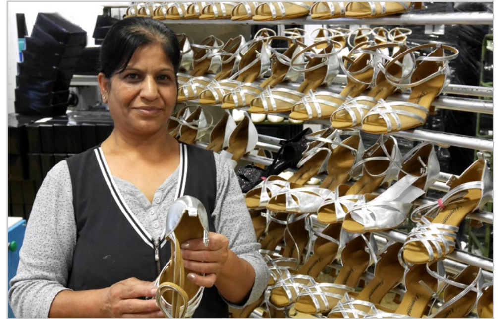
Schikila: im Unternehmen seit 2008 - in the company since 2008