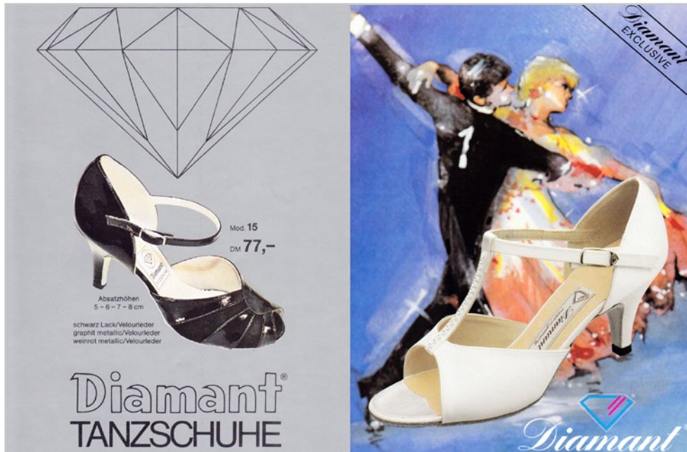
Spezialisierung auf Tanzschuhe im Jahre 1975 - Specialization in dance shoes in 1975