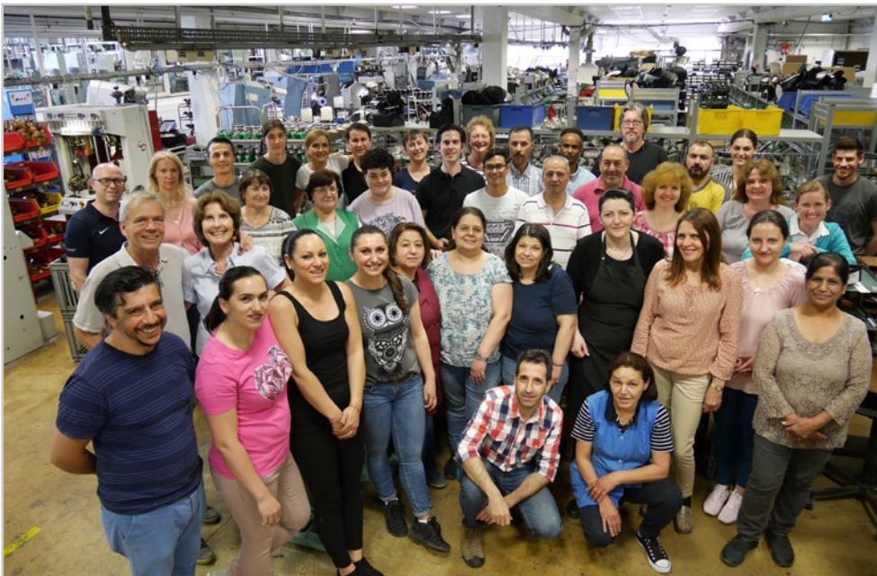
Belegschaft der Diamant Schuhfabrik - Workforce of Diamant Shoeproduction

Wir wünschen viel Spaß mit dem neuen Katalog und große Freude auf der Tanzfläche, Ihre Diamant Schuhfabrik und Belegschaft