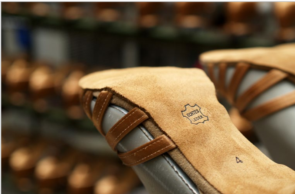
Hochwertige und geprüfte Materialien - High quality and tested materials