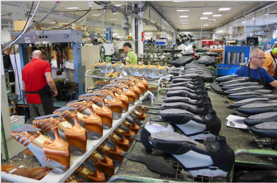
Deutsche Präzision und Handwerkskunst - German precision and craftsmanship