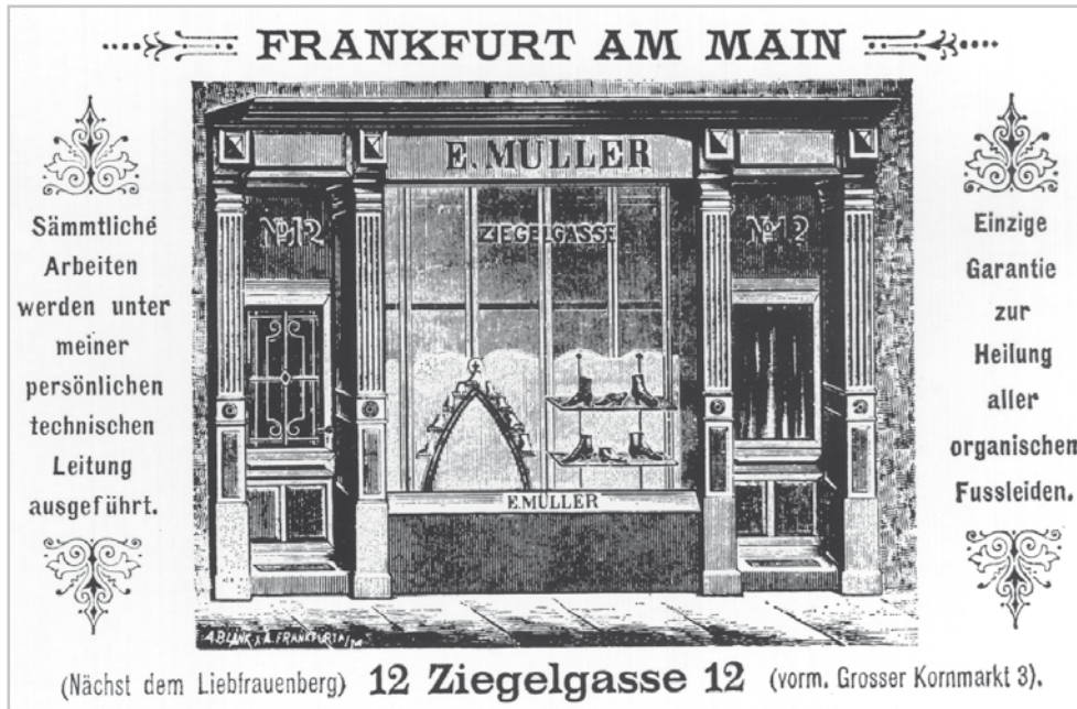
Eberhard Müller's Ladengeschäft in Frankfurt - Eberhard Müller's shop in Frankfurt